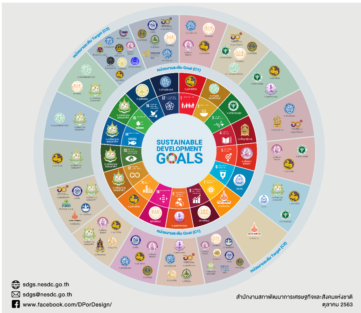
แผนภาพ ๔.๑ หน่วยงานรับผิดชอบและประสานงานหลักการขับเคลื่อนเป้าหมายการพัฒนาที่ยั่งยืน (รายละเอียดตามเอกสารแนบวาระที่ ๔)

๑.๒ หน่วยงานรับผิดชอบและประสานงานหลักการขับเคลื่อนเป้าหมายการพัฒนาที่ยั่งยืนในรายเป้าหมายหลักและเป้าหมายย่อย ปรากฏดังแผนภาพที่ ๔.๑