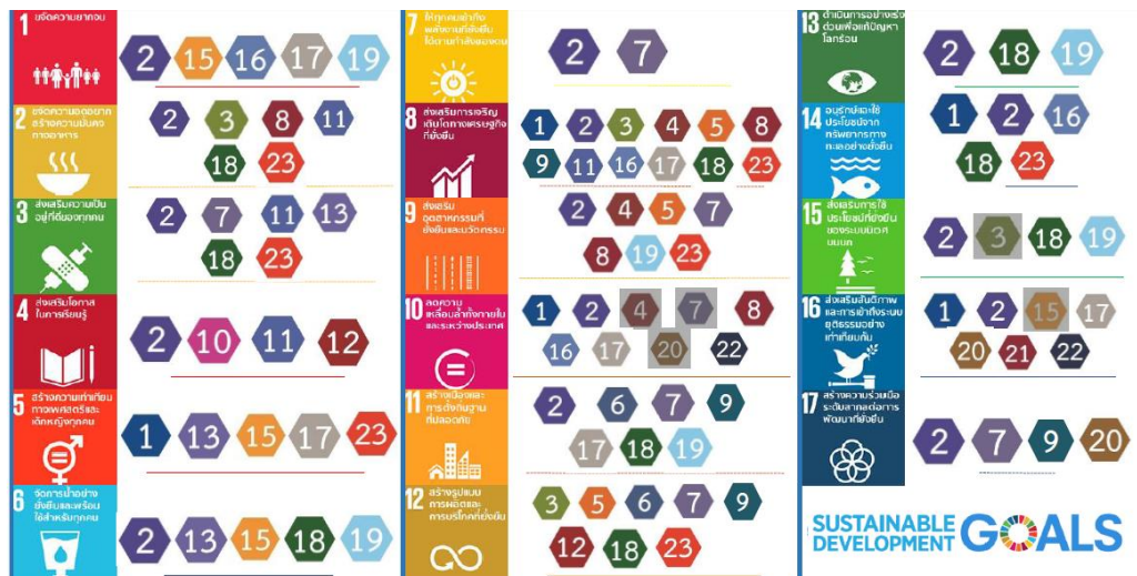
แผนภาพ ๔.๑-๑: ความเชื่อมโยงระหว่าง SDGs และแผนแม่บทภายใต้ยุทธศาสตร์ชาติ

๑.๒.๒ สสช. จะนำผลการวิเคราะห์ความเชื่อมโยงระหว่างเป้าหมายย่อยของเป้าหมาย การพัฒนาที่ยั่งยืนกับเป้าหมายระดับแผนย่อยของแผนแม่บทภายใต้ยุทธศาสตร์ชาติ ไปเป็นข้อมูลประกอบการเชื่อมโยงในระบบ eMENSOCR ที่มีข้อมูลแผนระดับ ๓ และ ข้อมูลโครงการ/การดำเนินงานต่าง ๆ ต่อไป